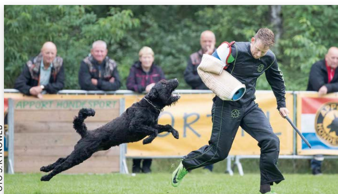
Het pakwerk is het meest spectaculaire onderdeel

Speuren: twee deskundige spoorleggers maakten het de keurmeester gemakkelijk om de prestaties te beoordelen. Na een lange periode van droogte was de ondergrond keihard en staken er lange grassprietten