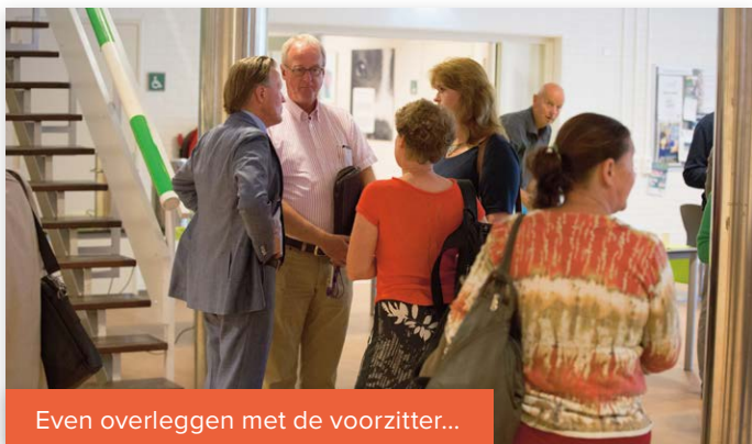
Even overleggen met de voorzitter...