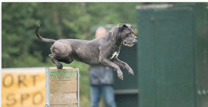
Opperste concentratie en focus...