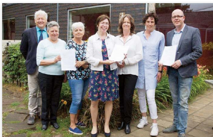
De ondertekenaars van het convenant op 24 juni jongstleden

Meer informatie staat op de website van de Raad van Beheer .