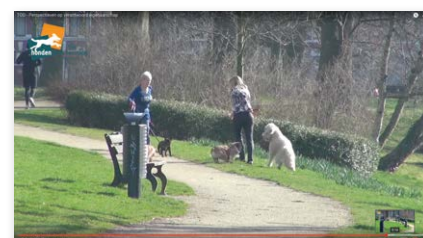
Beeld uit 'Ten Minutes on Dogs'

De video verschijnt in de reeks 'Ten Minutes on Dogs' en gaat in op oplossingsrichtingen voor de problematiek rondom zogeheten risicohonden. Bekijk de video