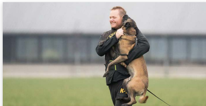
Blijdschap bij baas en hond na een goed afgelegde proef...