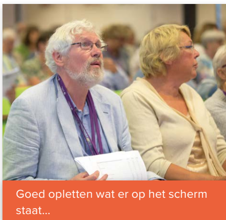
Goed opletten wat er op het scherm staat...