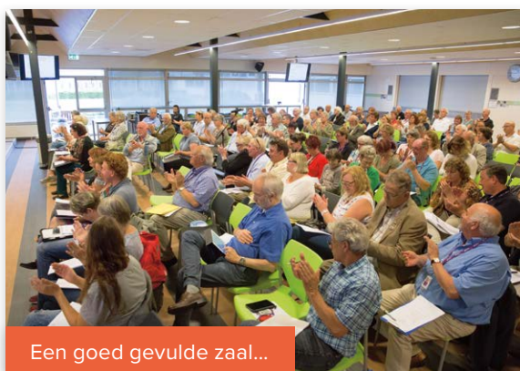
Een goed gevulde zaal...