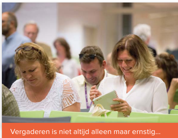
Vergaderen is niet altijd alleen maar ernstig...