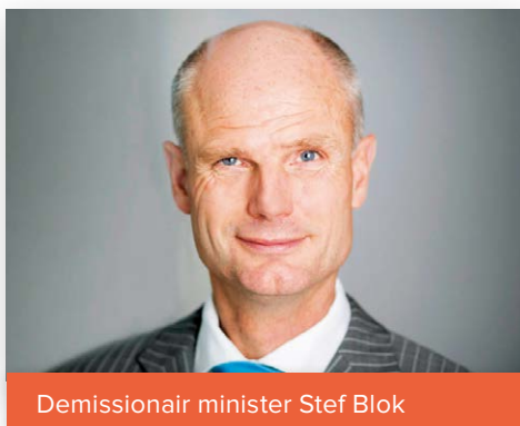
Demissionair minister Stef Blok

De eerste maatregel is het invoeren van een zelfstandig houdverbod ingeval van dierenmishandeling. Momenteel kan de rechter een houdverbod alleen opleggen als voorwaarde bij een voorwaardelijke straf. Dat geeft veel beperkingen, die met het zelfstandig houdverbod worden opgelost.