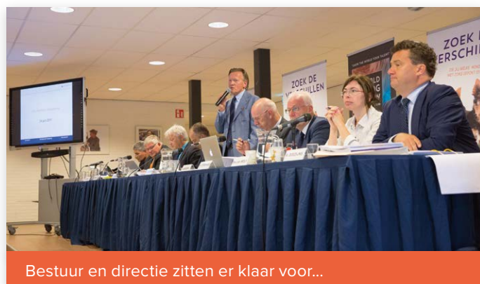
Bestuur en directie zitten er klaar voor...