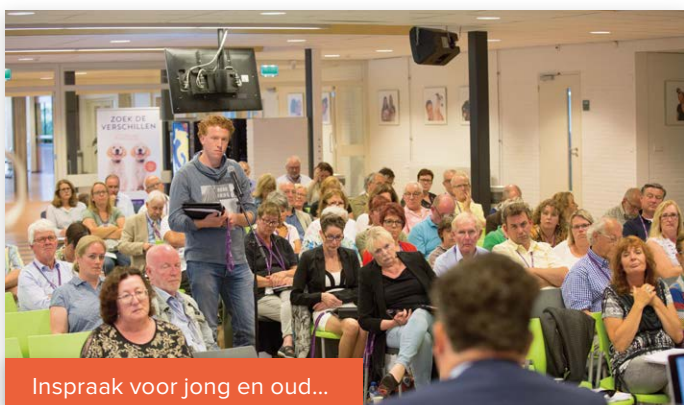
Inspraak voor jong en oud...