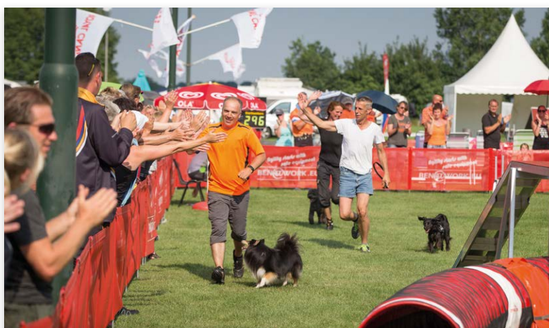
De winnaars maken een verdiend ere-rondje over het wedstrijdterrein en laten zich vrolijk toejuichen...

In de volgende editie van Raadar volgt een uitgebreid verslag van het NK Agility, met meer foto's en achtergronden. Voor uitslagen kunt u alvast kijken op onze Sportenwebsite .