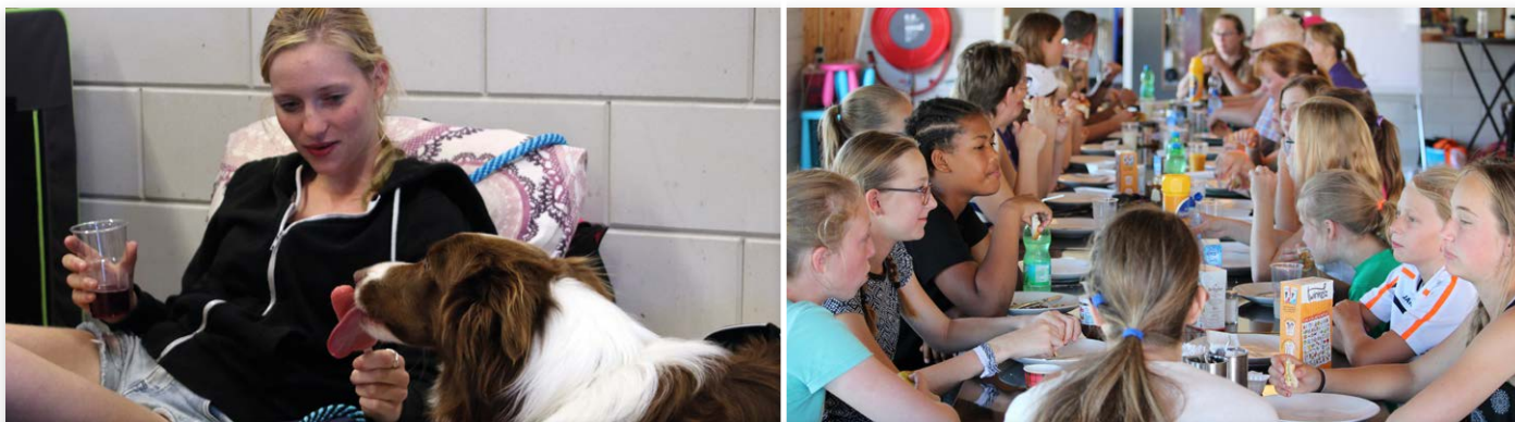
Beelden van het Raad van Beheer Youth Zomerkamp van 2016, een zeer geslaagde editie. Daarom dit jaar weer...