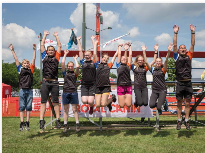
Niet alleen de honden sprongen er op los tijdens het NK Agility...