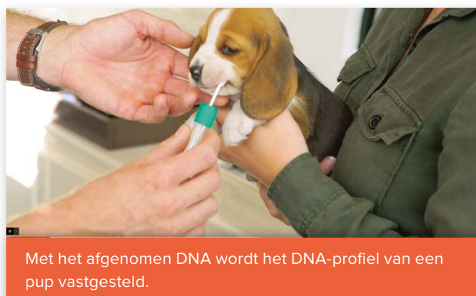
Met het afgenomen DNA wordt het DNA-profiel van een pup vastgesteld.

De serie video's is onderdeel van de campagne ‘Waarom een stamboomhond’, waarin we maar liefst twaalf