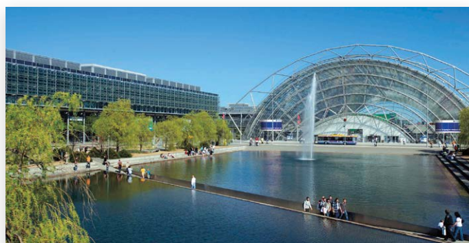
Het geweldige complex van de Leipziger Messe

Aanmelden als deelnemer aan de WDS 2017 kan via de website van de WDS 2017