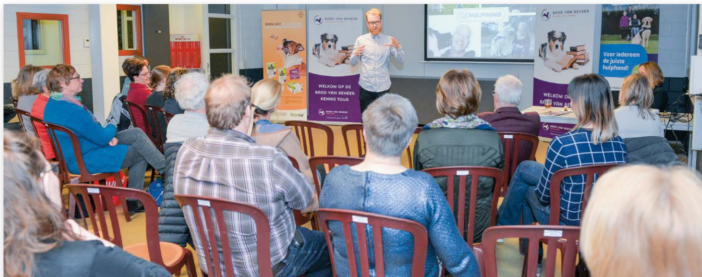
Een volle zaal genoot van een mooi kijkje achter de schermen bij Hulphond Nederland