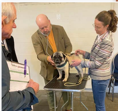
De honden worden voor en na een looptest nauwkeurig beluisterd

Cambridge University ontwikkelde een wetenschappelijk onderbouwde screening waarmee kortsnuitige honden op een functionele manier kunnen worden beoordeeld op luchtwegproblemen. De uitslag van de test wordt uitgedrukt in graderingen van 0 tot 3, waarbij 0 betekent dat de hond helemaal gezond is, en 3 dat de hond onder behandeling van een dierenarts moet worden gesteld. De Raad van Beheer haakt aan bij dit onderzoek, door in overleg met Cambridge University en de Engelse Kennelclub ook in ons land te werken aan de ontwikkeling van gevalideerde tests voor deze rassen.