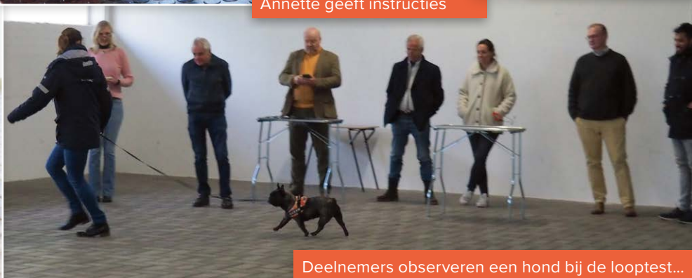
Deelnemers observeren een hond bij de looptest...