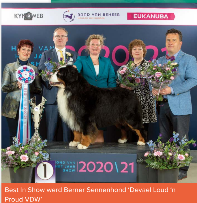
Best In Show werd Berner Sennenhond 'Devael Loud 'n Proud VDW'