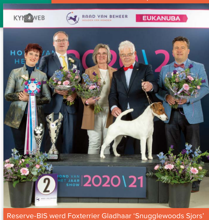
Reserve-BIS werd Foxterrier Gladhaar 'Snugglewoods Sjors'