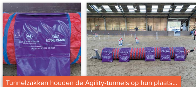
Tunnelzakken houden de Agility-tunnels op hun plaats...

Soeren. Tunnelzakken worden gebruikt om de Agility-tunnels op hun plaats te houden, en zo de veiligheid van de honden te borgen, die razendsnel door de tunnels rennen. Voor de baanleverancier is het vervoer van de zware zakken geen optie. Daarom heeft de Commissie Agility, gesponsord door onze partner Royal Canin, 35 tunnelzakken aangeschaft. Deze zijn nu standaard aanwezig en worden door Buitensportcentrum de Spreng zorgvuldig voor ons opgeslagen.