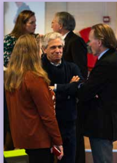
Overleg in de wandelgangen