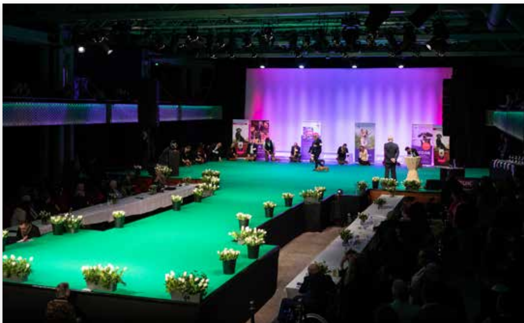
Dit jaar worden opnieuw de mooiste honden van het jaar op deze catwalk getoond

Nog even en dan is het zover: de Hond van het Jaar Show 2019. Deze geweldige show, met daarin de kynologische "crème de la crème", wordt gehouden op zondag 12 januari 2019 in De Flint, Amersfoort. Dat mag u niet missen, hetzij als (genodigde) deelnemer, hetzij als toeschouwer! Let op: de show begint al om 10.30 uur!