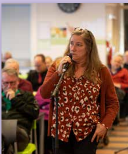
Ruimte voor discussie en vragen