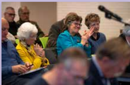
Applaus moet ook af en toe klinken...