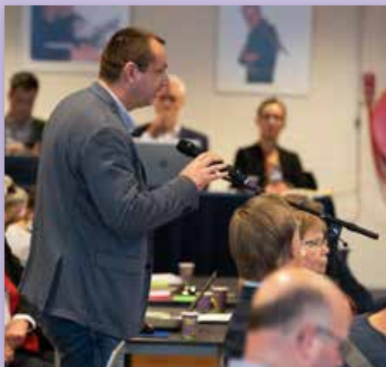
Ruimte voor discussie en vragen