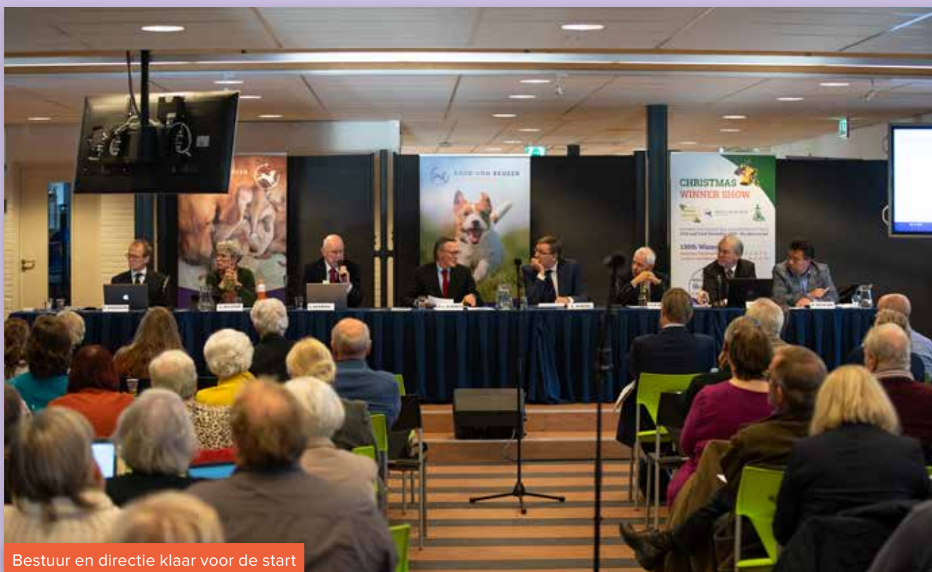
Bestuur en directie klaar voor de start

Op zaterdag 30 november 2019 vond de 50e Algemene Vergadering van de Raad van Beheer plaats. Hieronder treft u de besluitenlijst en een foto-impressie van deze vergadering..