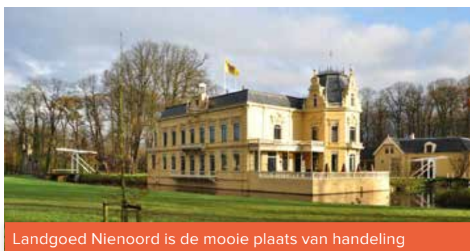
Landgoed Nienoord is de mooie plaats van handeling

De Nimrod is het jaarlijkse topevenement op jachtproevengebied. Alleen op uitnodiging kun je hieraan