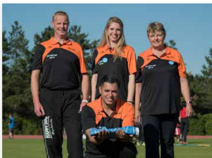
Overdracht FCI-vlag voor WK 2020