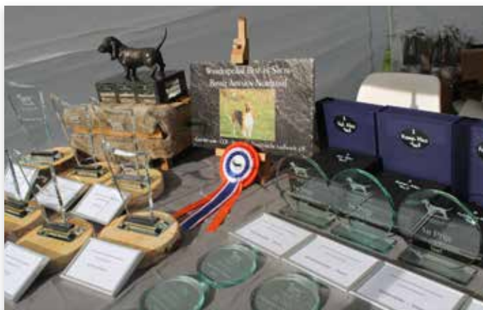
De honden van Nicole en Noud Horsten (foto rechtsboven) werden uitgeroepen tot winnaars