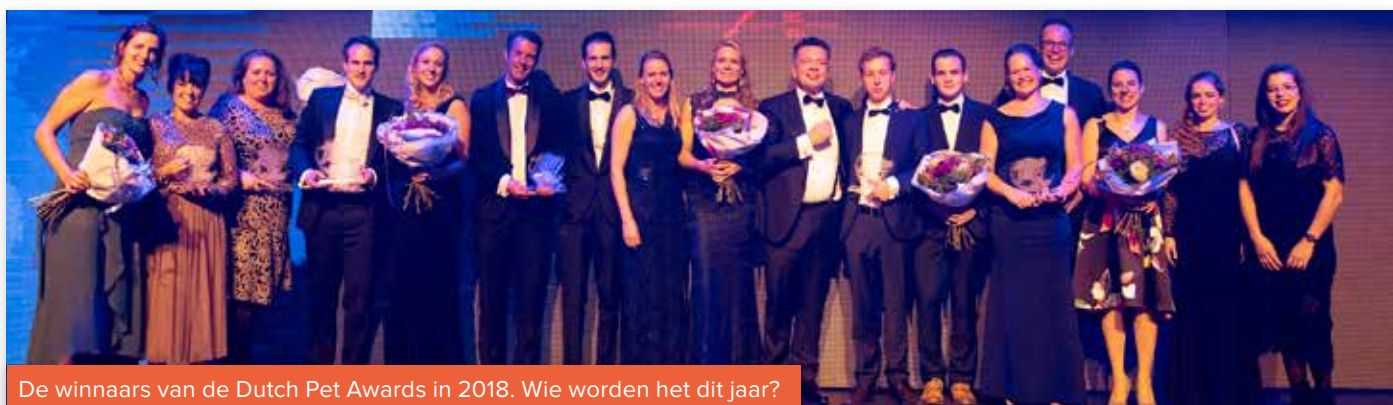
De winnaars van de Dutch Pet Awards in 2018. Wie worden het dit jaar?