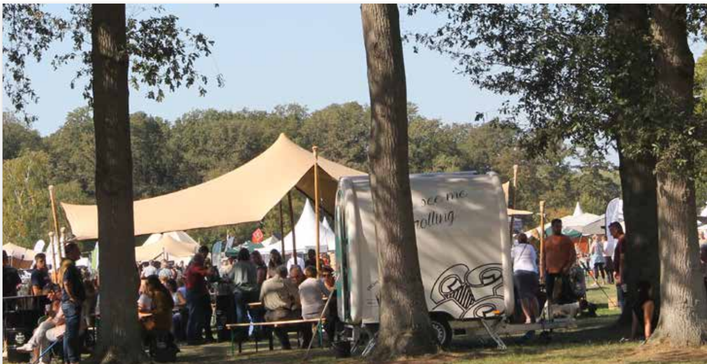
Het festivalterrein van Jacht en Buitenleven op landgoed Velder, een mooie locatie...

De uitdaging: organiseer een Kampioenschapsclubmatch voor de Franse Basset in de sfeer van de Nationale d'élevage, de clubmatch van onze Franse zustervereniging. In Frankrijk kun je als vereniging makkelijk aansluiten bij een 'Fête de Chasse', een jachtfestijn in de tuin van een chateau. Tal van Franse jachthondenrassen geven daar acte de présence . Een entourage met mooie meutes, jachtkleding, jachthoorns, kunst, kaas en wijn. Zie dat maar eens in Nederland te realiseren!