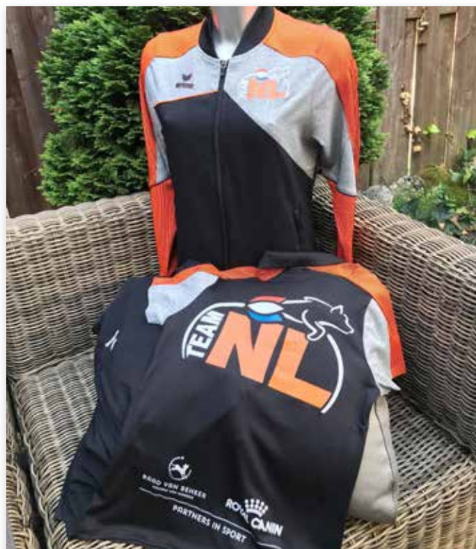
Kleding 2019 met dank aan onze partner in sport Royal Canin