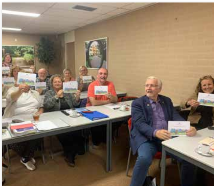
De deelnemers aan de evaluatie blij met de flyer...

Er moeten ook dingen beter. Zo werd geconstateerd dat Module 1, Erfelijkheidsleer (basis) moet worden aangepast en dat er in Module 6, Voeding en verzorging een aantal fouten in het deel over voeding moet worden verbeterd. Omdat de wet inmiddels is aangepast, moet ook Module 4, Wetten en regels worden aangepast. Als de nieuwe versies online staan krijgen docenten en leerlingen de juiste versie gemaild.