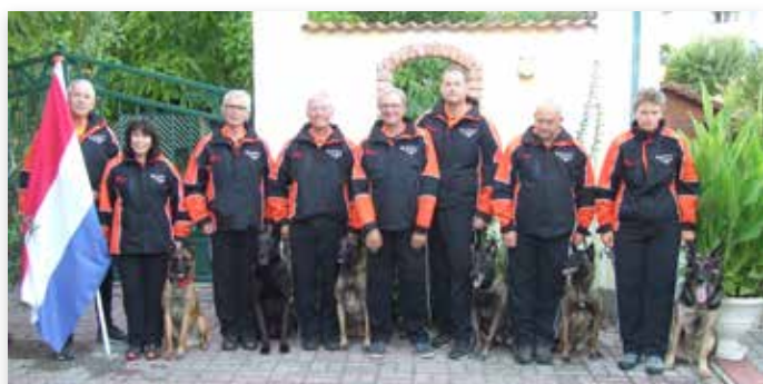
Het Nederlandse team deed goede zaken...

Er was ook een promotieteam afgereisd naar Oostenrijk om promotie te maken voor het WK dat in 2020 in Apeldoorn wordt gehouden. Zij hadden een promostand buiten het stadion en hebben veel liefhebbers van de sport te woord gestaan en flyers en VVV-mappen uitgedeeld. Op de maandag na het WK verzorgde het team nog een presentatie tijdens de gedelegeerdenbijeenkomst; ook hier werd promotiemateriaal uitgedeeld.