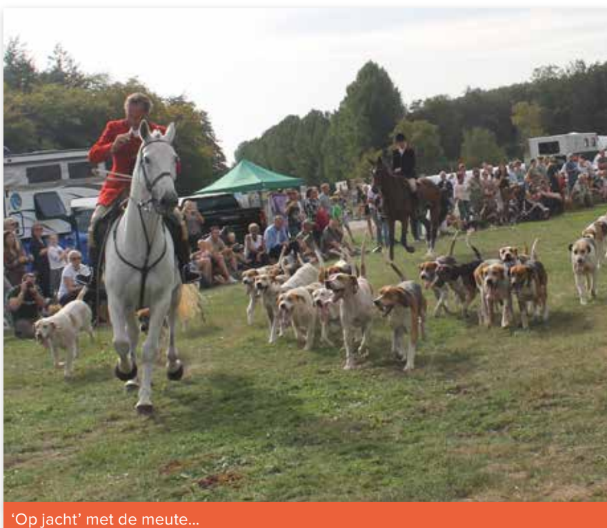
'Op jacht' met de meute...