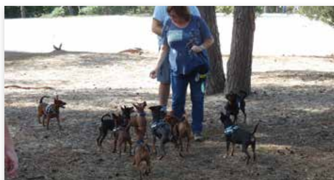
De viering bestond onder meer uit een wandeling met honden in natuurgebied "Loonse en Drunense duinen". Daarna receptie in een vrolijk versierde zaal.