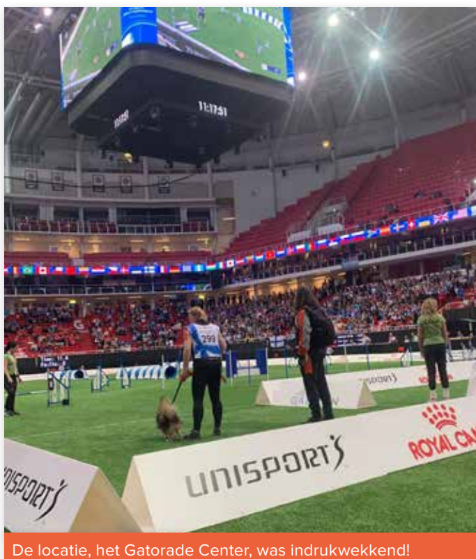
De locatie, het Gatorade Center, was indrukwekkend!

Door gedoe met de vliegmaatschappij en de stress die dat van tevoren opleverde, viel er al voor vertrek een combinatie af, waardoor we met elf combinaties startten.