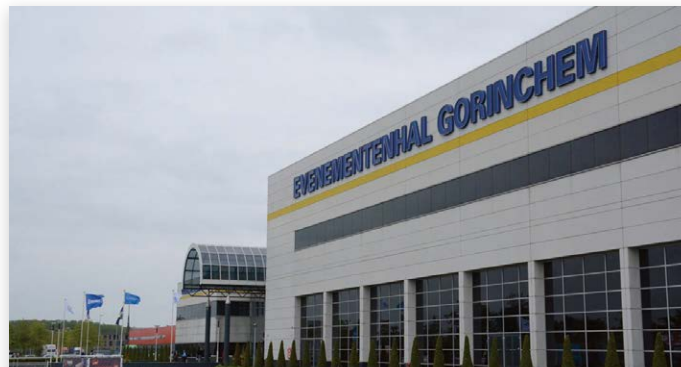
De Kerst Winner vindt plaats in de Evenementenhal Gorinchem

Belangrijke uitgangspunten bij de opzet van de Kerst Winner zijn onder meer een laagdrempelige en ongedwongen sfeer, mooie 'Winner-waardige' aankleding,