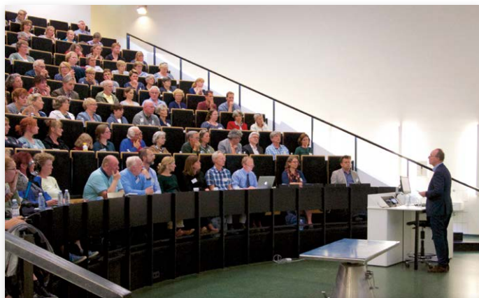
Het symposium trok net als vorige edities een volle zaal