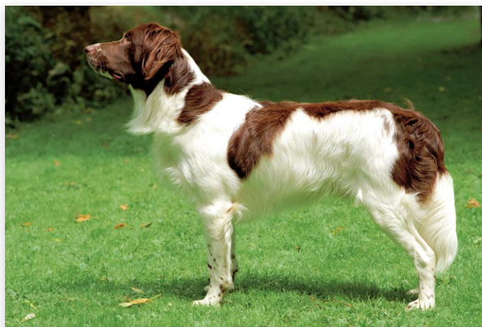
Maar liefst 107 Drentsche Patrijshonden nemen deel aan De Nationale

De Nationale is hét evenement van de Nederlandse hondenrassen. Natuurlijk is de show mooi om te zien en is het bijzonder om te ervaren wie de allermooiste is. Maar het gaat vooral ook om de beleving. Onze Nederlandse hondenrassen (en de eigenaren) zijn nuchter. Geen