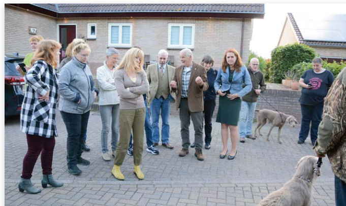
De rasvereniging had echte honden meegebracht, die de keurmeesters buiten uitgebreid konden bestuderen

Beide seminars hebben ertoe geleid dat enkele aspirant-keurmeesters hun bevoegdheid voor deze rassen hebben gekregen, en voor een aantal anderen zal dit naar verwachting binnenkort gebeuren. Ook zijn de seminars geaccrediteerd als nascholing voor keurmeesters. De meerwaarde van deze seminars