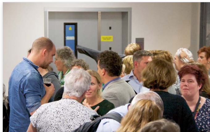
Na afloop werd er druk nagepraat en gediscussieerd

Op woensdagavond 12 juni jl. werd in Utrecht voor de vierde maal het symposium Genetica voor de Kynologie gehouden, een goede samenwerking tussen de Universiteit Utrecht - Faculteit Diergeneeskunde (ExpertiseCentrum Genetica voor Gezelschapsdieren) en de Raad van Beheer . Het symposium trok een volle zaal met bijna 200 toehoorders, die gretig waren om meer te leren over genetica.