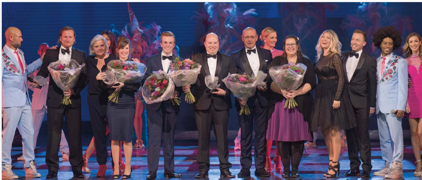
Alle winnaars van de Dutch Pet Awards 2017 op een rij