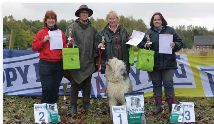
Op zondag ging de eerste plaats bij IHT-1 naar de Old English Sheepdog Rover; Blue Berry's Prince Snowboots.

In het weekend van 21 en 22 oktober 2017 werden in Heikant, Zeeuws-Vlaanderen, officiële FCI Herding Trials Traditional Style (schapen drijven met andere honden dan Border Collies) gehouden. Kort verslag van Ingrid Schautteet Faas, kynologisch instructeur.