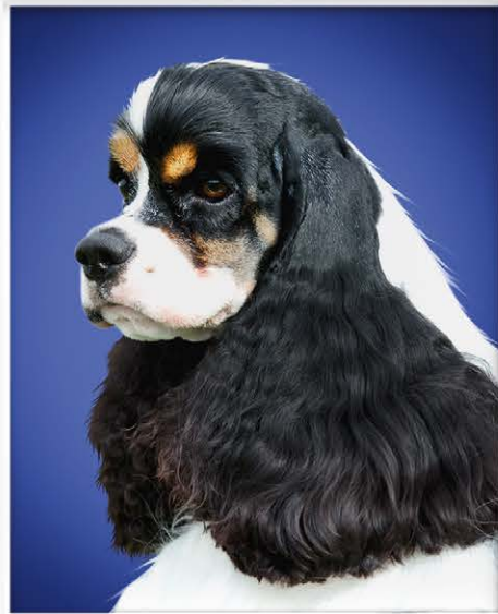
MIAMI BEST IN SHOW