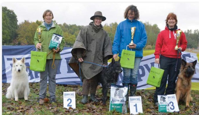
Op zaterdag werd de IHT-2 gewonnen door de Hollandse herder ruwhaar Multi champion Ubor Rodo van de Bothof.