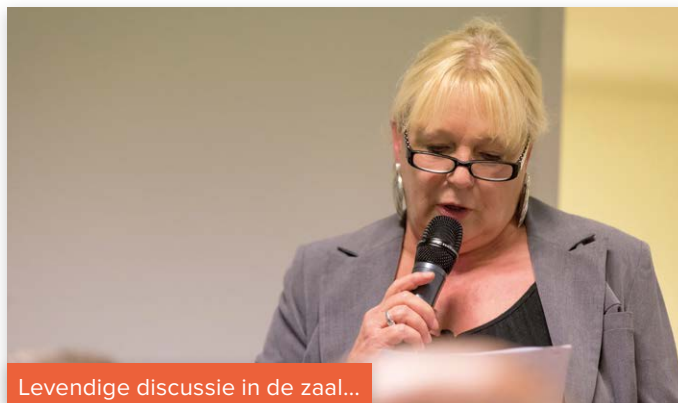
Levendige discussie in de zaal...