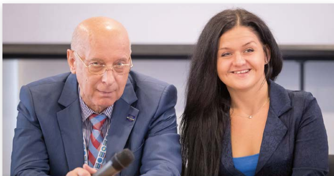
Voorzitter en vice-voorzitter van de Oekraïense Kennelclub