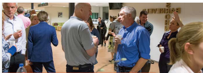
Gesprekken in de wandelgangen...