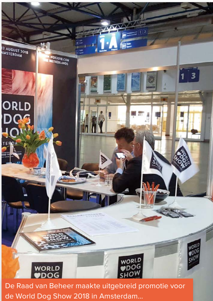
De Raad van Beheer maakte uitgebreid promotie voor de World Dog Show 2018 in Amsterdam...