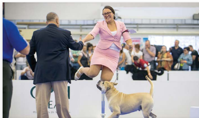
Dat noem je 'Van blijdschap een gat in de lucht springen'