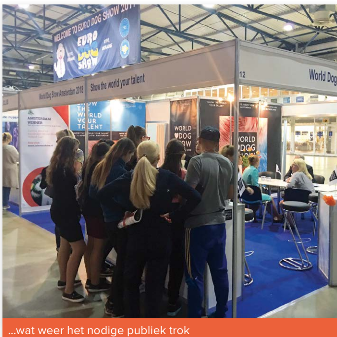
...wat weer het nodige publiek trok

De Raad van Beheer was prominent in Kiev aanwezig om de World Dog Show 2018 in Amsterdam te promoten in de speciaal daarvoor ontworpen stand, die een klinkklare eyecatcher bleek te zijn. ‘Show the world your talent’ was het motto. Het was dagelijks een drukte van belang en de WDS2018-boekjes en -flyers, tasjes, sleutelhangers en pennen gingen als zoete broodjes over de toonbank. Net als de Nederlandse kaas, dropjes en koekjes... Veel mensen gaven aan dat zij gaan inschrijven voor de WDS2018, en sommigen bleken zelfs al een hotel te hebben geboekt. Een geslaagde missie!