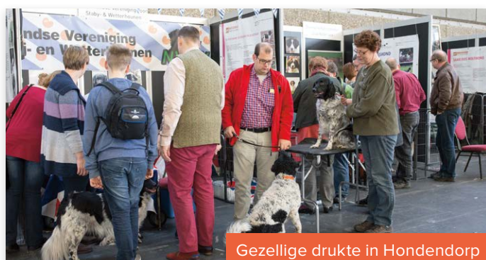
Gezellige drukte in Hondendorp