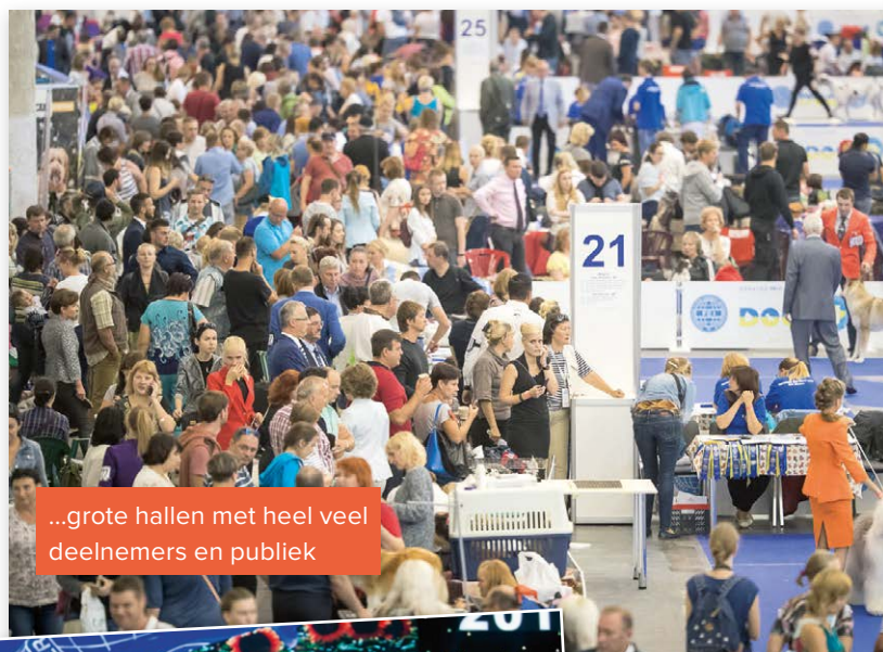
...grote hallen met heel veel deelnemers en publiek