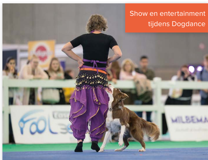
Show en entertainment tijdens Dogdance

verdeeld over de diverse RAI-hallen. Voor de keuringen, waar circa 300 hondenrassen aan deelnemen, is een internationaal team van de beste keurmeesters aange trokken. Zij keuren ook op fit for function , gezondheid en welzijn. Om toe te zien op het dierenwelzijn tijdens het evenement is het Honden Welzijn Team (HWT) aanwezig.