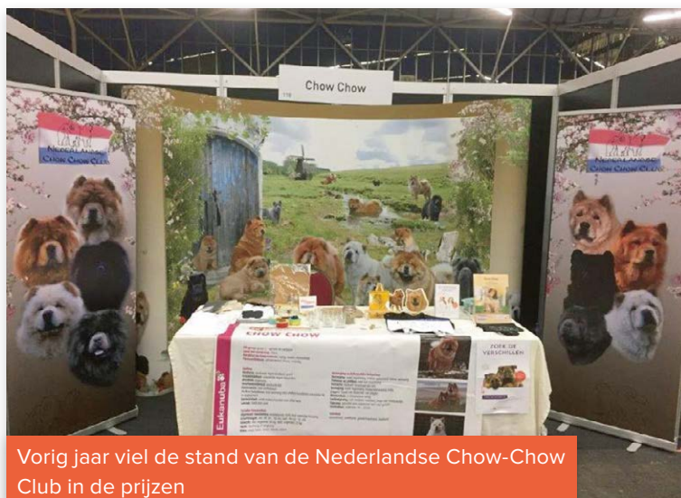
Vorig jaar viel de stand van de Nederlandse Chow-Chow Club in de prijzen

Bij de beoordeling van de beste stand van het Hondendorp wordt, behalve naar de verzorgde aankleding, ook gekeken naar de uitstraling die past bij de achtergrond en/of gebruik van het ras. Denk hierbij bijvoorbeeld aan de specifieke kenmerken van een land, maar ook aan de sporten die horen bij het desbetreffende ras, oorspronkelijk gebruik enzovoort. Ook maakt de originele en pakkende wijze waarop de campagne ‘Waarom een stamboomhond’ wordt gepromoot, onderdeel uit van de beoordeling. Dus doe mee met uw ras, kleed de stand origineel aan en maak kans op mooie prijzen!