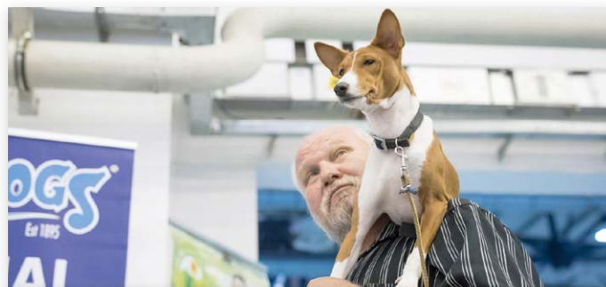
De liefde tussen hond en baas blijft voorop staan