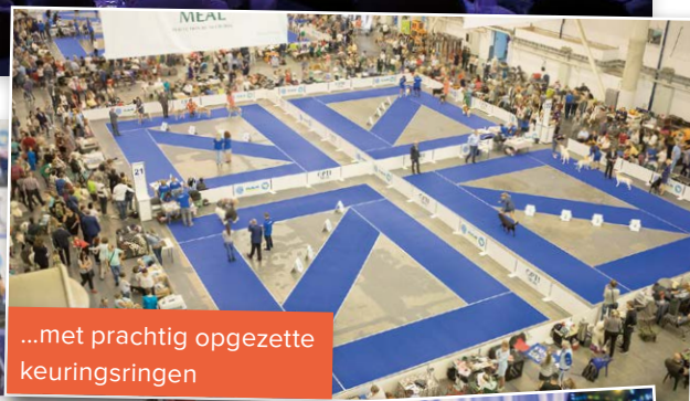
...met prachtig opgezette keuringsringen