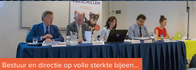
Bestuur en directie op volle sterkte bijeen...