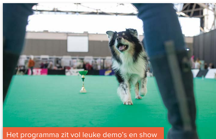
Het programma zit vol leuke demo's en show