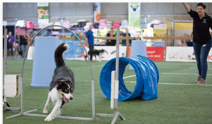
De sporten zijn goed vertegenwoordigd..