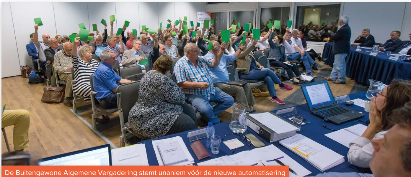
De Buitengewone Algemene Vergadering stemt unaniem vóór de nieuwe automatisering

Het proces om dit nieuwe applicatielandschap te realiseren wordt nu zo spoedig mogelijk in gang gezet. Omdat de modernisering en professionalisering van de automatisering van essentieel belang is, informeren wij u vanaf nu regelmatig in Raadar over de stappen die we in dit proces zetten.