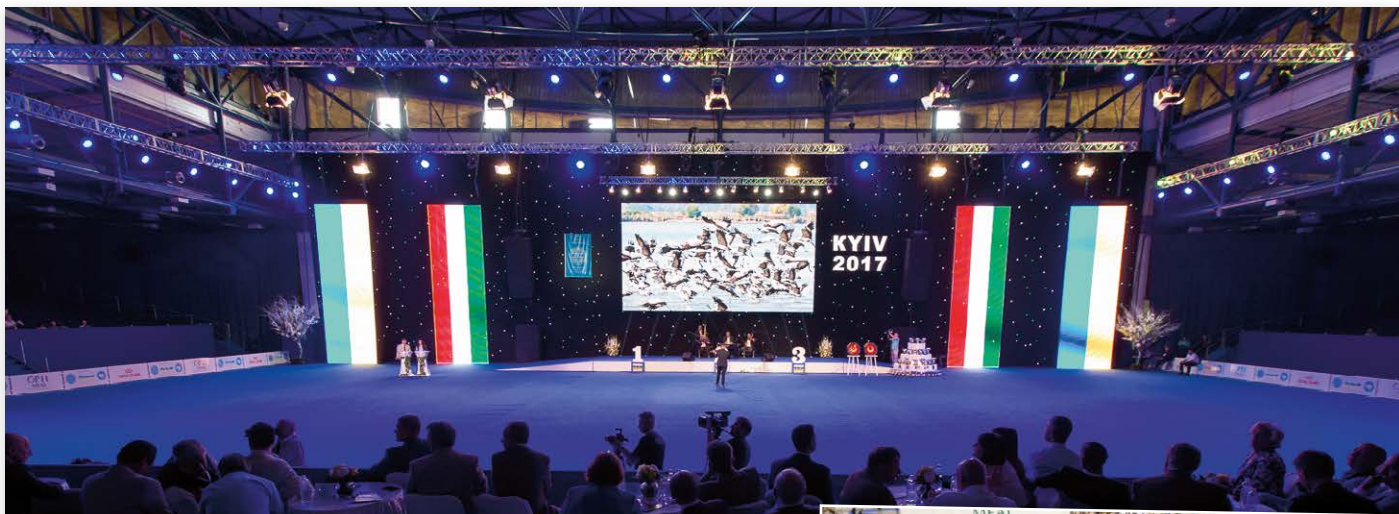
De organisatie in Kiev pakte het groots aan...