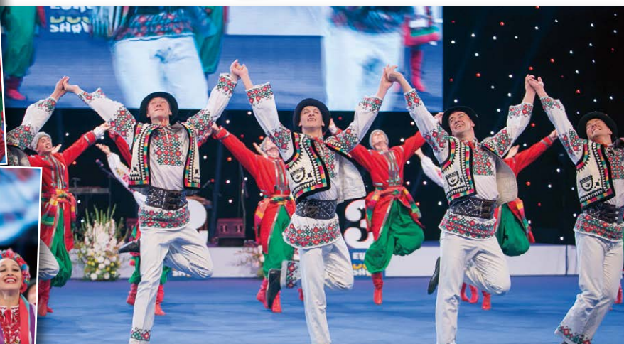
...met wervelende dansshows bij de start van het ereringprogramma