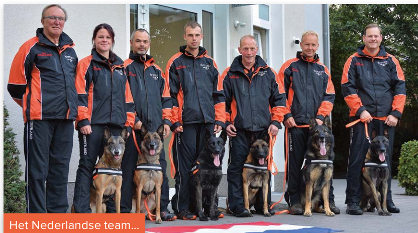
Het Nederlandse team...

Van 14 - 17 september werd in het Duitse Rheine het Wereldkampioenschap IPO gehouden. Het Nederlandse team, ondersteund door onze partner in working dogs Royal Canin, presenteerde zich uitstekend en liet zien dat de IPO-sport in Nederland weliswaar niet op kan tegen grootmachten als Duitsland en Tsjechië, maar dat er zeker rekening met ze moet worden gehouden. Kort verslag van Gerard Besseling, Commissie Werkhonden.