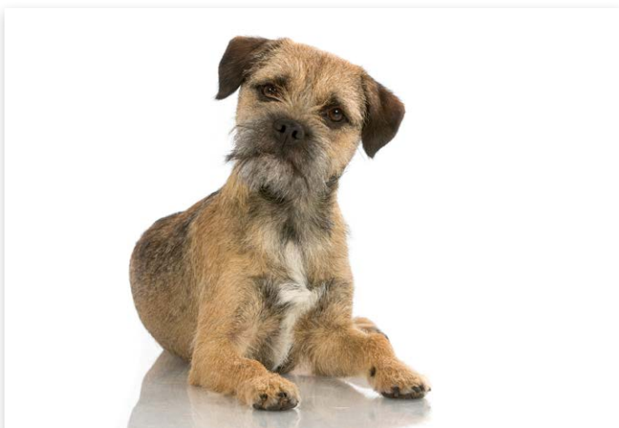
Juiste antwoord april: Border Terrier

Op onze Facebook-pagina kunt u iedere eerste dag van de maand meedoen aan het spel 'Raad het Ras'. In samenwerking met Kynoweb plaatsen we een vertroebelde foto van een rashond en u moet raden om welk ras het gaat. Onder de inzenders van het goede antwoord wordt iedere maand een boek verloot: 'Fokken van rashonden' of 'Handboek Kynologische Kennis 1'.