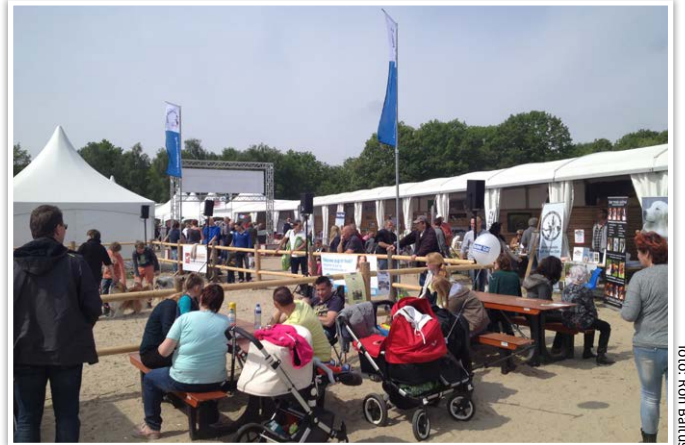
Volop publiek in het Raad van Beheer Rashondendorp

Gezien het grote succes van Animal Event 2014, zal de Raad van Beheer ook volgend jaar dit evenement steunen. Zet de data alvast in de agenda: 8, 9 en 10 mei 2015. En houd de website in de gaten: http://www.animal-event.info/