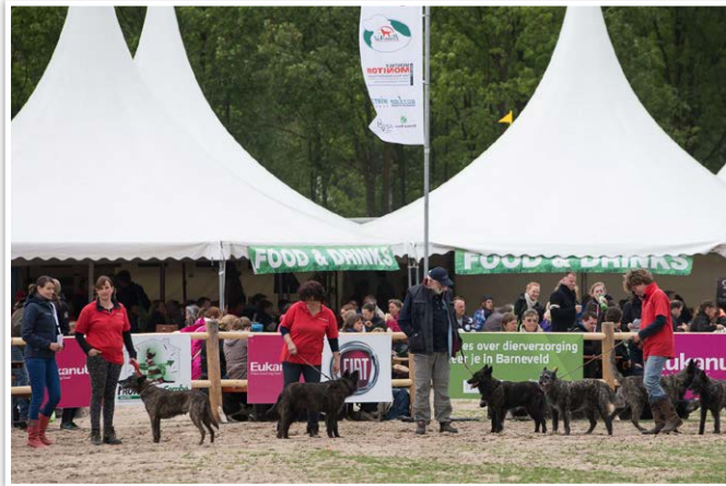
Rashondenparade Herdershonden in de grote piste.

De Raad van Beheer is ieder jaar aanwezig met een stand en ondersteunde de 25 rasverenigingen die daar acte de présence gaven. De rasverenigingen hebben bezoekers