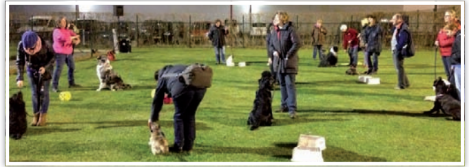
Plezier bij de instructeurs tijdens de workshop voor de Dag van de Hond.