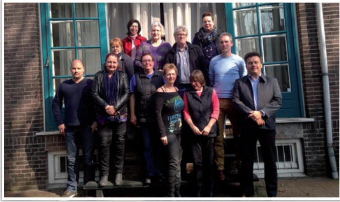
De buitendienstmedewerkers of 'chippers' van de Raad van Beheer. Directe schakel tussen bureau en fokkers.

Met vaste regelmaat komen de buitendienstmedewerkers van de Raad van Beheer – de chippers - voor overleg naar het kantoor van de Raad van Beheer in Amsterdam. Tijdens dit overleg worden diverse onderwerpen met elkaar besproken. De Raad van Beheer ziet zijn buitendienst als een belangrijke schakel tussen de fokkers en de het kantoor van