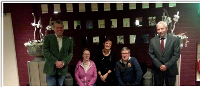
De interim commissie kynologisch instructeur.

Op de website van de Raad van Beheer staat nu een aantal opleidingen dat voldoet aan de eindtermen van de CKI. Echter, de commissie gaat de eindtermen actualiseren op basis van nieuw verworven inzichten. Mocht u, als organisatie/vereniging, van mening zijn of het wenselijk vinden om door de Raad van Beheer als opleidings-