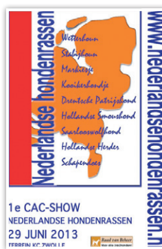
1e CAC-show van de Nederlandse Hondenrassen

Voor het eerst in de geschiedenis van de kynologie werd er voor alle Nederlandse hondenrassen een gezamenlijke Kampioenschapclubmatch georganiseerd – de 1e CAC Show voor de Nederlandse Hondenrassen. Op meerdere fronten mag deze op 29 juni 2013 in Zwolle gehouden tentoonstelling een succes worden genoemd. De samenwerkende rasverenigingen kunnen terugkijken op een bijzondere dag, want de 574 inschrijvingen zijn het bewijs dat er ruimte is voor dit soort speciale shows.