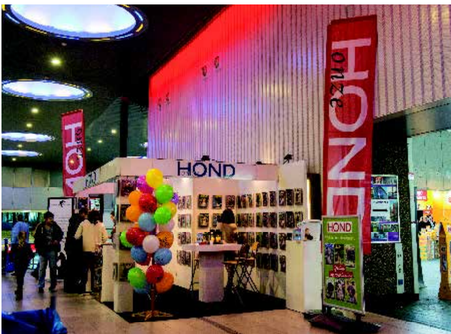
De opvallende stand van ONZE HOND in de entreehal.