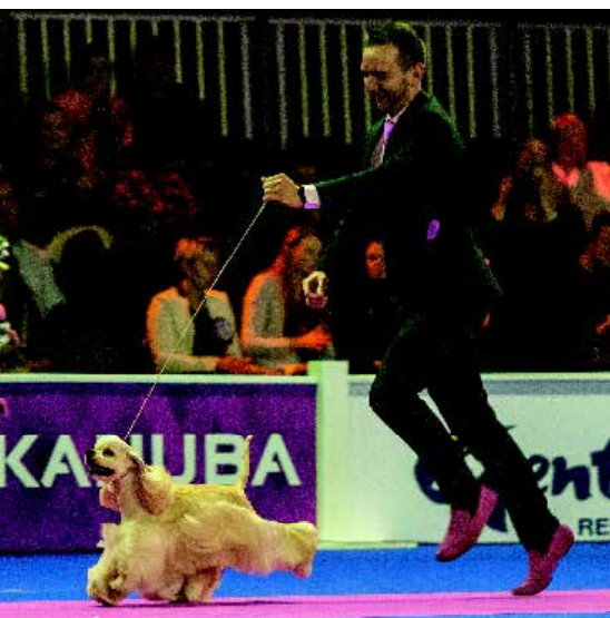
De winnaar van de Eukanuba World Challenge 2015, de Amerikaanse Cocker Spaniel reu 'Very Vigie I Don't Know'.

Er is veel reclame gemaakt voor de show. Via radio, aanplakbiljetten