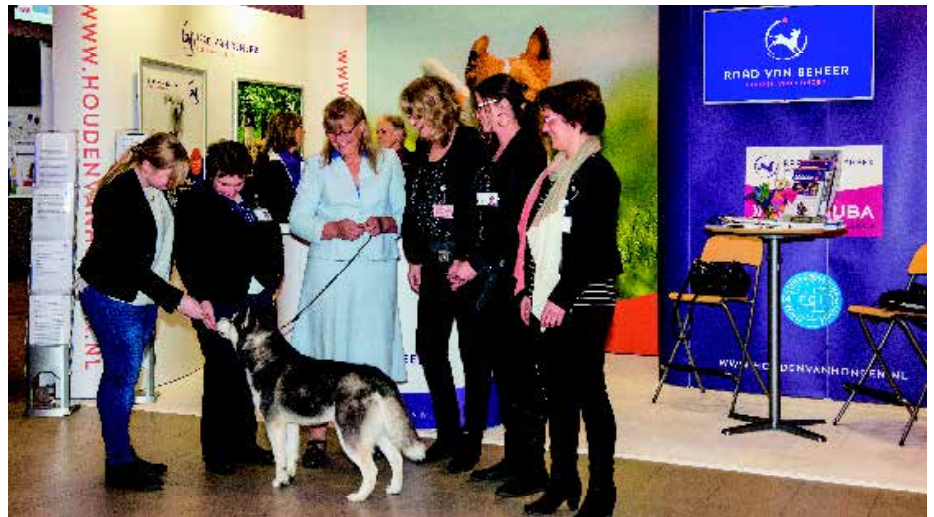
Het Honden Welzijn Team voor de fraaie stand van de Raad van Beheer.

Nieuw dit jaar is het initiatief van de Raad van Beheer om in navolging van de internationale overkoepelende organisatie, de F.C.I., een aanpak te bedenken om de jeugd meer te betrekken bij de kynologie. Het is een project dat de Raad na aan het hart ligt. De kynologie vergrijsst en het is belangrijk dat kinderen al op jeugdige leeftijd op een goede manier leren omgaan met honden. In tijden dat welzijn en gezondheid van de rashonden hoog in het vaandel staat, wil de Raad van Beheer ook hier onderstrepen dat de Winner niet alleen gaat over showen van honden, maar dat het zeker zo belangrijk is om op allerlei gebied te leren omgaan met honden. Onderdelen hiervan zijn verzorging, gehoorzaamheid, sport en spel. Hiervoor is er in het afgelopen jaar een Nederlandse Youth Werkgroep opgericht, bestaande uit negen teamleden. Er komen activiteiten en vaardigheden aan bod als grooming, Junior Handling, obedience, maar ook jacht en agility. Dit weekend is de première en treedt de werkgroep voor het eerst naar buiten. Er zijn de hele dag demonstraties van alle