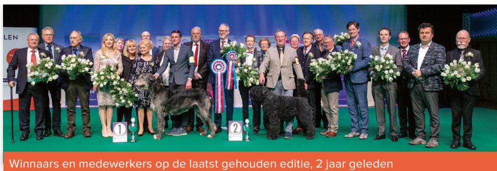
Winnaars en medewerkers op de laatst gehouden editie, 2 jaar geleden

In verband met de COVID-pandemie kon de Hond van het Jaar show 2020 vorig jaar niet plaatsvinden. Op 2 april wordt de show daarom voor zowel 2020 als 2021 gehouden. Voor de Hond van het Jaar Show 2020 & 2021 worden honden uitgenodigd die zich in 2020 en/of 2021 hebben gekwalificeerd.