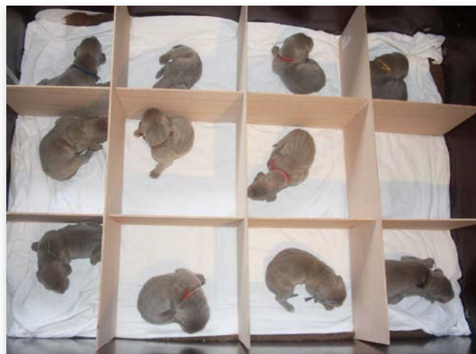
Bij dit nestje Weimaranerpups van fokker Irja Schierbeek werd na tien dagen DNA afgenomen. Daartoe werden de pups van elkaar gescheiden om fouten te voorkomen. (De foto is ter illustratie, het ging hier niet om dubbeldekking!)

Bij een geplande dubbeldekking om de genenpool van het ras te vergroten is vaak sprake van een bijzondere situatie. Dit vraagt om extra organisatie van de fokker. Zo kan het voorkomen dat de reuen niet bij elkaar in de buurt wonen of makkelijk kunnen reizen. Daarbij moet men wel voorzichtig zijn, want hiermee kunnen ook ziektes zoals sexueel overdraagbare aandoeningen worden overgebracht. Natuurlijke dekking dient altijd het uitgangspunt te zijn. De bijzondere situatie van een ras in combinatie met de reisafstand van de twee reuen en het risico van overdraagbare ziektes zijn echter redenen om in dit geval kunstmatige inseminatie (KI) te overwegen. De afspraken met de eigenaren van de dekcreuen moeten natuurlijk goed gemaakt worden. Vragen deze een vast bedrag, dan bent u dubbele kosten kwijt. Hanteert de eigenaar een andere berekening, bijvoorbeeld een bedrag per levend geboren pup, dan zijn de kosten voor de fokker minder hoog. In dit geval heeft de